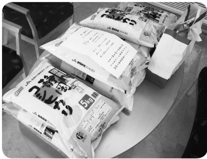
ハイナン農協 『新米・お茶』

平成十四年に御前崎に移住したのを機にロフェリーは退会しましたが、この間「ロフェリーの集い」に十四回中十一回、さらに福祉施設等の慰問に多数参加することができました。今は喜寿を超えてしまいました。空気のきれいな御前崎で出来る限り活動を続けたいです。