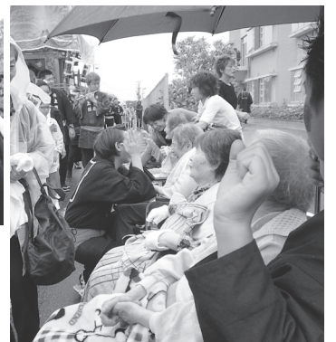
駒形神社祭典の際に、地域の屋台が通りにぎやかでした。

また、行楽日和になり動物園や川根の方に外出をしたユニットがあります。遠出は初めてのことで不安がいっぱいでしたが、楽しんだようです。利用者さんの楽しみも広がるので、これをきっかけに遠出の機会を増やしたいと思っています。